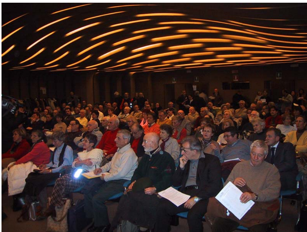
Assemblea di risparmiatori all'auditorium della Camera di Commercio di Firenze

I crack finanziari di questi anni rappresentano un vero e proprio dramma sociale, perché risultano essere circa 850.000 i risparmiatori coinvolti, alcuni dei quali hanno perso i risparmi di una vita e l'ammontare delle perdite è stimato in 37 miliardi di euro.