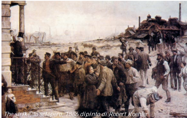
The strike, lo sciopero, 1886 dipinto di Robert Koehler

tre per quattro la sentenza sarà eseguita l'anno successivo. Nel 1893 il Governatore dell'Illinois riconoscerà l'ingiustizia del processo e l'innocenza degli imputati. A ricordo di questi fatti e di quei martiri innocenti nel 1889, il Congresso di Parigi dell'Internazionale socialista proclamò il 1° Maggio Festa internazionale del Lavoro. Da allora il 1° Maggio divenne la giornata simbolo delle lotte operaie che rivendicavano il pieno riconoscimento dei loro diritti di lavoratori e di uomini e ben presto a quella giornata si accompagnerà una piattaforma che sintetizzava il fine delle lotte operaie del tempo: una giornata equamente divisa tra il lavoro, il riposo e lo studio. Ma con la Festa del Lavoro il movimento operaio si conquista anche un giorno del calendario ufficiale borghese. Il 1° Maggio di ogni anno sarà un giorno di festa. Non si la-