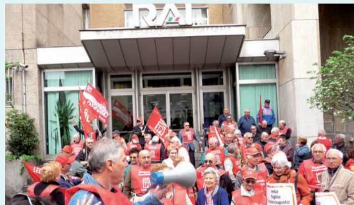
Presidio alla Rai di Milano il 14 aprile