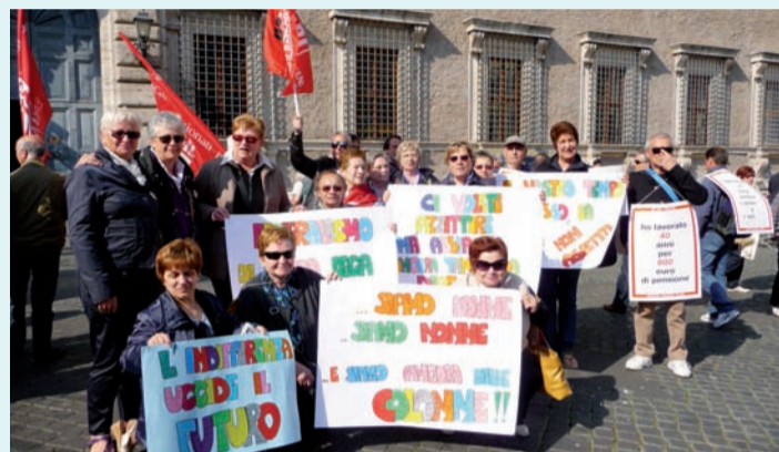
Protesta a Roma in piazza Farnese il 19 aprile