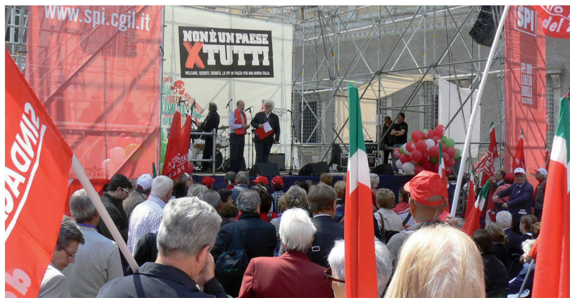
Roma 19 aprile, il presidio Spi in piazza Farnese