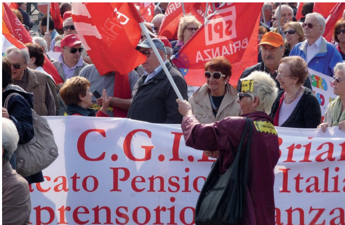
Grande corteo anche a Monza il 6 maggio in occasione dello sciopero generale promosso dalla Cgil.