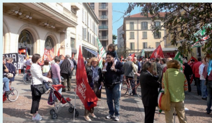
Primo maggio in piazza San Paolo