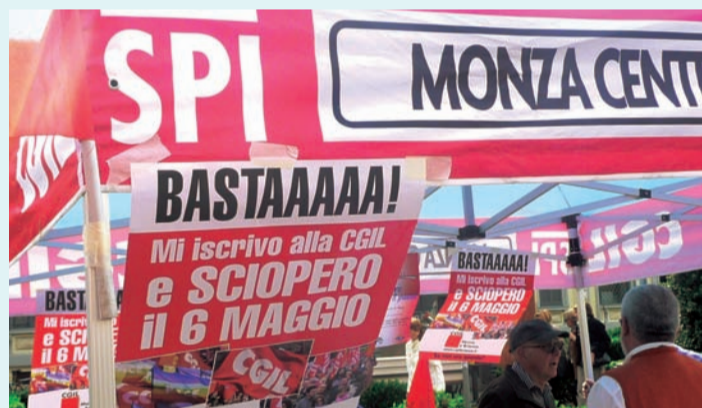
Gazebo in centro a Monza il 28 aprile