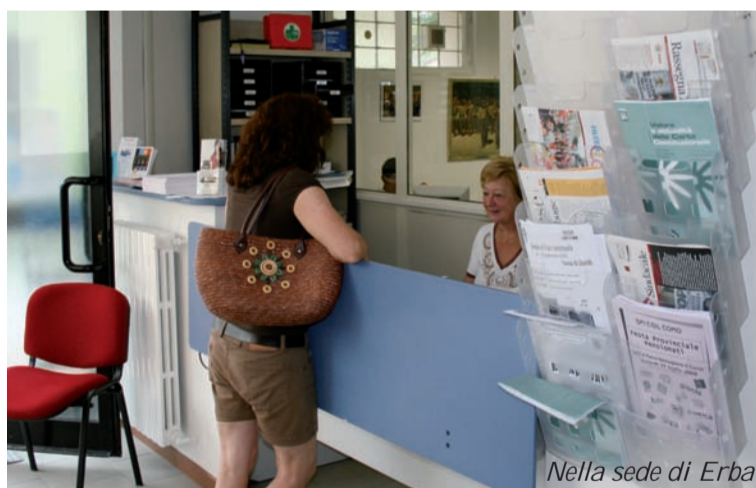
Nella sede di Erba

Il 70% dei 200 pensionati dell'Erbese intervistati dai volontari della lega Spi di Erba-Canzo sembrerebbe vivere abbastanza bene, grazie alla casa di proprietà e soprattutto al sostegno del contesto familiare. E l'altro 30%? Denunciano un disagio economico aggravato dall'età (il 62% supera i 75 anni) e manifestano bisogni primari non soddisfatti; e per lo più non sanno di avere diritto ad alcune agevolazioni. Denunciano: eccessivo costo degli affitti, mancanza di negozi e di spazi verdi con panchine raggiungibili a piedi, insufficienza dei trasporti pubblici, lontananza dagli ambulatori e tempi di attesa lunghissimi, carenza di luoghi e occasioni di socializzazione, assenza del famoso vigile di quartiere, che dovrebbe essere il primo interlocutore a cui rivolgere le proprie istanze. In realtà, a parte l'affitto, questi disagi sono comuni anche a chi "sta bene" - come già detto - per merito dei familiari, veri e propri costruttori di benessere. Dall'indagine emerge un quadro abbastanza preciso dello stile di vita degli anziani dell'Erbese: la tv la fa