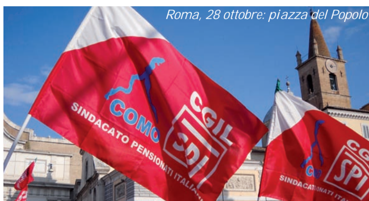
Roma, 28 ottobre: piazza del Popolo

culazione finanziaria e immobiliare piuttosto che investire nella produzione, nei servizi, nelle infrastrutture, nella prevenzione e nella cura delle persone e dell'ambiente. Non ci sarà sviluppo, se continua la precarietà dei giovani, se stipendi e pensioni continueranno a perdere potere d'acquisto e prevalentemente su di essi graverà il carico fiscale, per pagare gli interessi sul debito e per mantenere un intervento pubblico sempre più limitato e diseguale. Invece di fare le pulci a chi le tasse già le paga, bisogna andare a prendere i soldi nelle immense ricchezze private, frutto in buona parte di evasione fiscale o di posizioni privilegiate e di monopolio, chiedendo di contribuire a quelli cui finora non è stato chiesto niente. ■