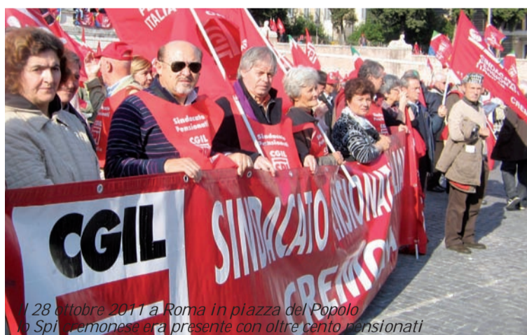
Il 28 ottobre 2011 a Roma in piazza del Popolo la Spi cremonese era presente con oltre cento pensionati

A dir la verità qualche piccolo passo in avanti il Governo lo ha compiuto: infatti dopo due anni, si è accorto che c'è la crisi e di conseguenza, il nostro premier ha smesso di invitarci a spendere i nostri piccoli risparmi bancari per sostenere