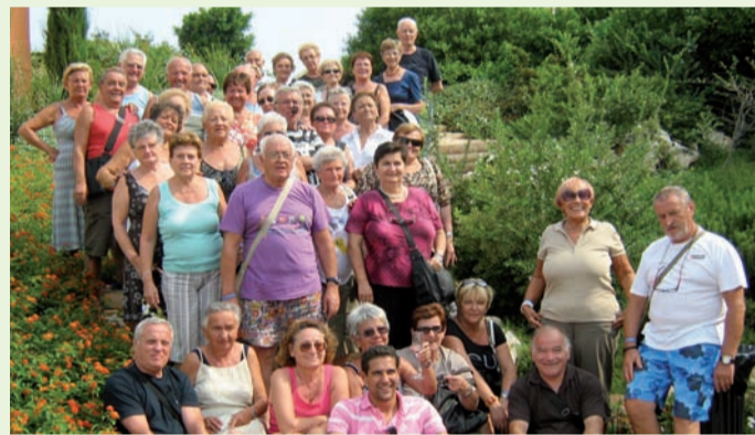
I volontari della lega di Casalpusterlengo in Puglia