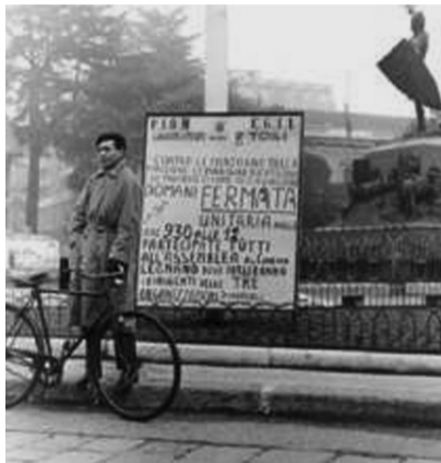
Sciopero alla Franco Tosi il 21 novembre 1964