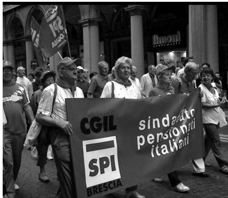
Lo Spi-Cgil di Brescia dopo aver ricevuto la ormai tradizionale “Staffetta delle stragi” che ogni anno parte da Milano per fare tappa nella nostra città in ricordo delle vittime della bomba del 28 maggio si è recata con una propria delegazione a Bologna il 2 agosto per partecipare, come da questa immagine, alla manifestazione in ricordo della strage della stazione ricongiungendosi ai podisti della staffetta.