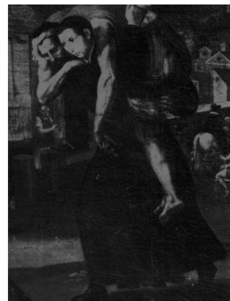
Un'immagine di Luigi Gonzaga mentre trasporta un appestato romano e ne resta contagiato mortalmente

Il contagio della peste fu il colpo decisivo per Luigi Gonzaga, che morì nella notte dal 20 al 21 giugno