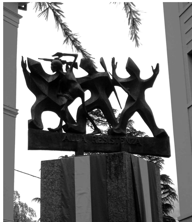
Il Monumento alla Resistenza di Sondrio

"La Repubblica italiana riconosce a titolo di risarcimento soprattutto morale il sacrificio dei propri cittadini deportati e internati nei lager nazisti nell'ultimo conflitto mondiale." Così recita il comma 1271 dell'ultima finanziaria, ora legge n. 296/06 dello stato italiano. È un'affermazione importante, un riconoscimento doveroso anche se molto tardivo. Se però si prosegue nella lettura si prova un acuto senso d'insoddisfazione per la pochezza dei contenuti che non riprendono nemmeno tutti i benefici previsti dalle proposte di legge giacenti in Parlamento da parecchio tempo. "È autorizzata la concessione di una medaglia d'onore..." Speriamo che ciò avvenga con il dovuto rispetto e dando la necessaria importanza alla cerimonia in modo che il risarcimento morale non scivoli nella presa in giro. La legge inoltre istituisce presso la Presidenza del Consiglio un comitato e finanzia l'operazione con uno stanziamento di 250mila euro: 150mila se ne vanno per il funzionamento del comitato, il rimasuglio va alle medagliette. Chi ha già presentato domanda di indennizzo alla Germania tramite l'OIM, cioè tutti coloro che si sono rivolti ai sindacati, ai Patronati o agli Istituti storici per la Resistenza, non deve fare niente perché i nominativi sono già conosciuti. Per tutto il resto seguiranno istruzioni che pubblicheremo di volta in volta. Fin qui l'insoddisfazione causata dalla mon-