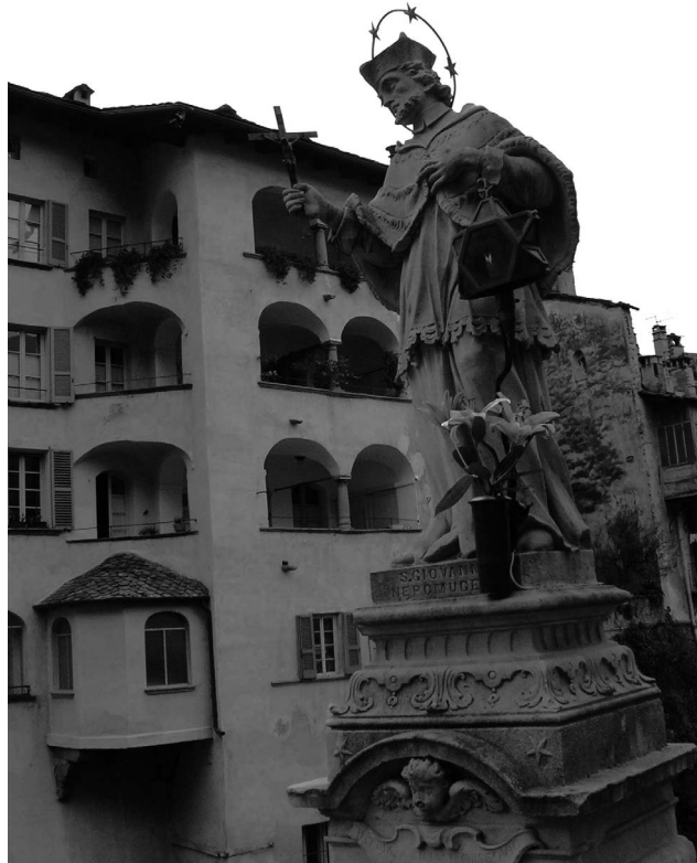
Chiavenna, il Castello