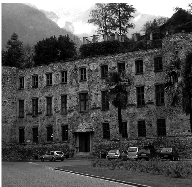
Uno scorcio di Chiavenna

L'amministrazione ha deciso, per tutelare i ceti deboli, di non aumentare tasse e tariffe, salvo l'adeguamento Istat sulla Tarsu. Il finanziamento aggiuntivo per i giovani servirà a finanziare la polisportiva, a migliorare l'informa giovani e a prevedere degli spazi per attività culturali e ricreative. Sindacati e amministrazione concordano sulla necessità di mantenere e potenziare il distretto sanitario di Berbenno, indispensabile per la medicina sul territorio.