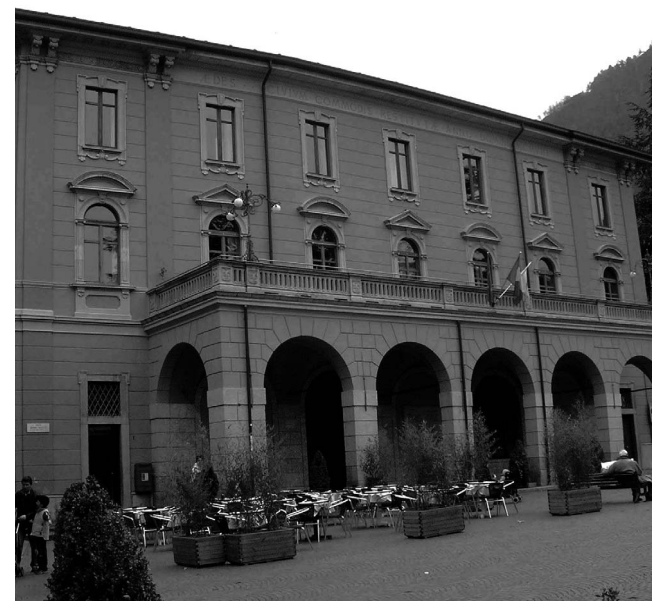
Il Municipio di Chiavenna

La notevole razionalizzazione dei servizi consente un buon contenimento dei costi e quindi non aumenteranno i prelievi a carico dei cittadini. Anzi la Tarsu diminuirà del 10 per cento e si confermerà la riduzione del 33 per cento a chi vive solo. L'Amministrazione intende ristrutturare un vecchio edificio pubblico e progetta di ricavare alcuni alloggi protetti. Chiede ai sindacati di farsi portavoce degli effettivi bisogni.