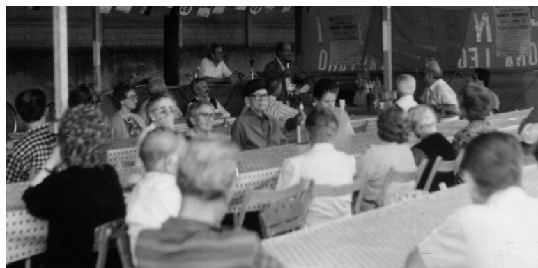
Nella foto un momento delle giornate del pensionato svoltesi negli anni 1988 - 1997.

L'attuale sede è predisposta anche per la compilazione dei