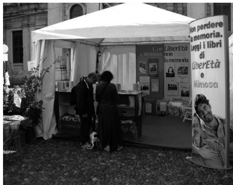
Al Festivaletteratura eravamo presenti con in gazebo di LiberEtà in Piazza Sordello. Tante sono state le persone che in quei quattro giorni di festa si sono fermate a curiosare e a chiedere informazioni su di noi e sulle pensioni. Appuntamento è per l'anno prossimo.

La criminalità si è accorta della debolezza dello Stato e della politica, e si infiltra in tutti i gangli della società. Lo Stato è debole perché la politica è debole o assente. Una proposta semplice come quella di costituire una Agenzia nazionale a cui affidare la gestione efficace dei beni confiscati al-