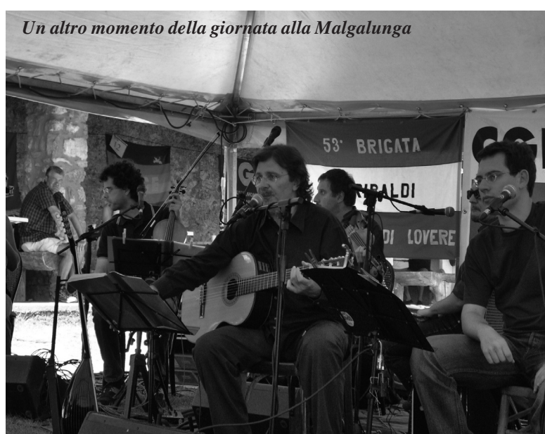
Un altro momento della giornata alla Malgalunga

tivi alle condizioni, ai bisogni e necessità dei cittadini anziani nell'ambito della discussione del piano socio assistenziale che il Comune sta predisponendo; 2) al fine di facilitare la compilazione e il pagamento dell'Ici, l'amministrazione invierà ai contribuenti il prospetto relativo alle caratteristiche unità immobiliari oggetto dell'imposta ed al calcolo della stessa; 3) l'importo minimo al di sotto del quale l'Ici non è dovuto, è stato portato da euro 2,04 a euro 10,00; 4) l'amministrazione comunale, al fine di consentire alle organizzazioni sindacali dei pensionati di erogare servizi di recapito ed assistenza sindacale, di patronato ed attività di segretariato sociale in genere, metterà a disposi-